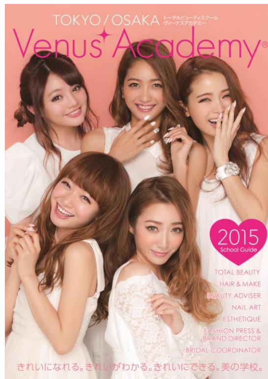
-ヴィーナスアカデミー学校ガイド-

ファッション、ヘアメイク、ビューティ、グラフィックデザイン、映画、映像、フォト、ゲーム、マンガ、アニメ、パティシエ、カフェ、フードコーディネーターなどのクリエイティブ分野に特化し、即戦力人材を育成するスクール運営事業を行っている Vantan(バンタン)(本部所在地:東京都渋谷区 代表:長澤俊二)は、2014年4月、ネイル、エステ、ファッション、ヘアメイク、ブライダル分野のトータルビューティスクール「ヴィーナスアカデミー大阪校」を開校致します。