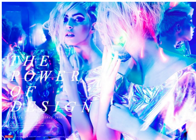
- バンタン卒業修了制作展『VANTAN STUDENT FINAL 2018』キービジュアル -