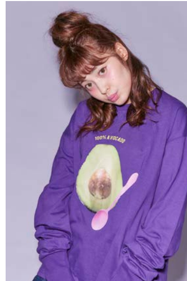
100% AVOCADO LONG SLEEVE TEE ¥6400+tax