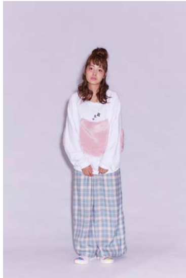
PINK FUR POCKET SWEAT ¥6800+tax

instagram @rrr.by.sugar.spot.factory: https://www.instagram.com/rrr.by.sugar.spot.factory/