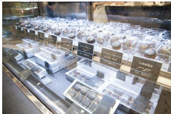
- 学内コンテストで最優秀グランプリに選ばれた学生のスイーツ(マカロン)を渋谷ヒカリエ ShinQs に出展(2015年2月) -