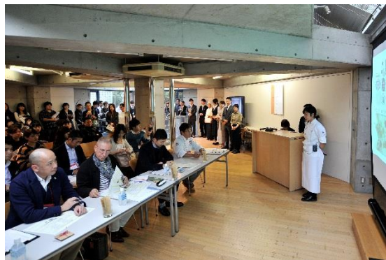
- 昨年度実施したイベントの様子 -