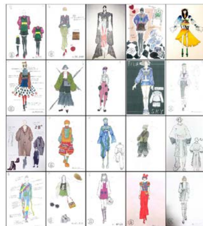
- 『AFC High School Contest』左) ロゴ 中央) 募集ポスター 右) 一次審査通過作品 -

今回初の『AFC High School Contest』の応募テーマは、「2018年あなたが着たいオリジナルスタイリング」。スタイル画での応募、審査選考を進めます。2次審査を通過した高校生の作品は実際に制作を進めた衣装にて最終審査と発表を致します。その過程の中では審査員・アドバイザーなどの専門クリエイターによる、指導・サポートにより制作を進める事が可能です。