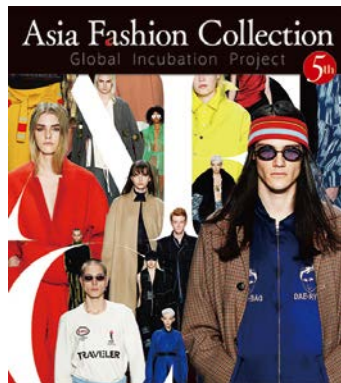
- AFC5th2017-2018 キービジュアル -

今回の“Asia Fashion Collection 5th（アジアファッションコレクション、以下AFC）東京ステージ”は、一次のポートフォリオ審査・二次トータル審査を経て残りました国内の7ブランドと、韓国・台湾・香港それぞれから選抜された3ブランド、合計10ブランドのコレクションが発表されます。