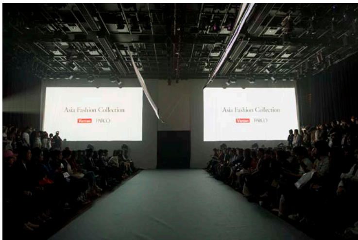
当日 700 名を超える観客が来場

授賞式の後には、参加デザイナーと審査員、そして多くのバイヤーとメディア関係の方々との懇親会が行われ参加デザイナーとの様々な意見交換が行われました。