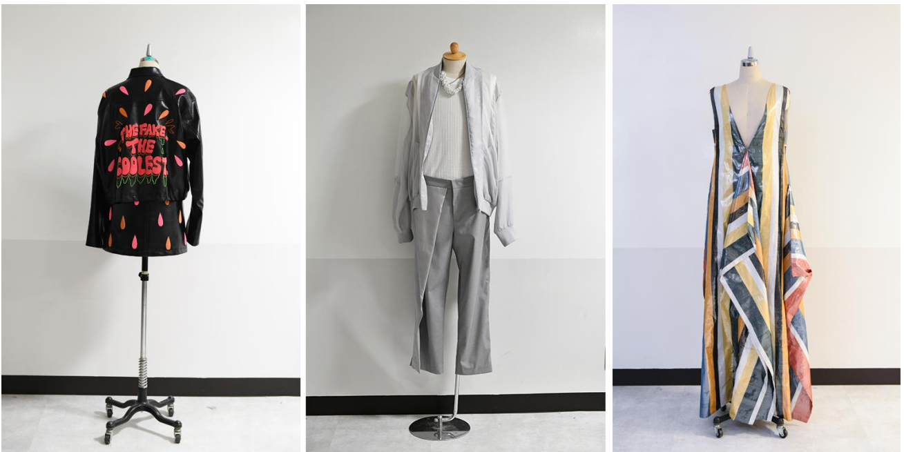
(左から) 韓国代表 『VEGAN TIGER (ヴィーガン タイガー)』 / 台湾代表 『SEANNUNG (ショーンノン)』 / タイ代表 『CHALISA BRAND (チャリサブランド)』