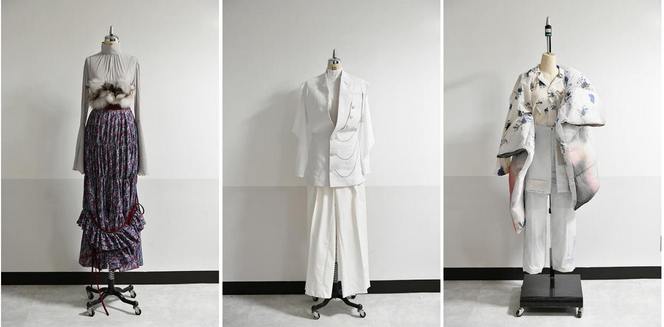
(左から) 『aNANA tih sayim (アナナ・ティ・シャイム)』 / 『ito (イト)』 / 『KTOKA (カトカ)』