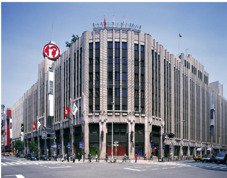
- 左: パーソナルロボット Pepper 右: ハックソン作品が展示される伊勢丹新宿本店 -

このイベントは、Pepper を用いて、三越伊勢丹が取り組む「デジタルとファッションの融合」の未来を、学生やエンジニア、ご来店のお客様と一緒に考えることをテーマとしています。